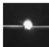
写真1 アーク放電(交流200V2A)